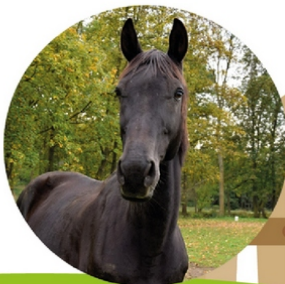
valach Čerkés, 13 let