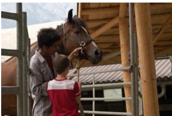
Article Mascha Dabić, 07. July 2011, in der Standard (AT)

https://diakonie.at/einrichtung/ankyra-zentrum-fuer-interkulturelle-psychotherapie-tirol